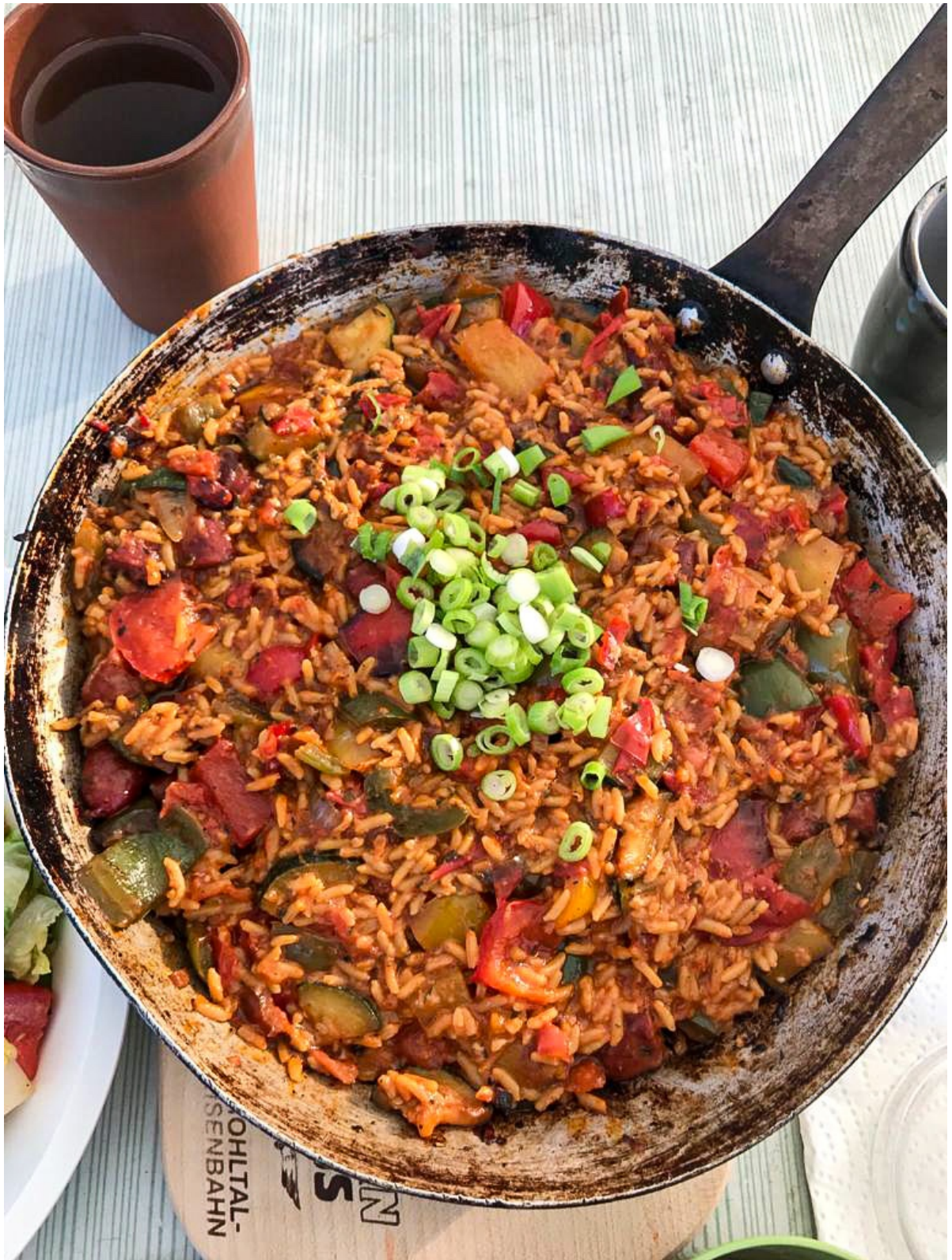
Eine Rustikale-Reispfanne

Wieder einmal hat sich meine Erkenntnis bestätigt, dass auch in unserer näheren Umgebung kleine Abenteuer, kulinarische Genüsse und Momente der Erholung zu finden sind!