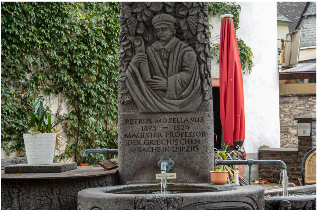
Petrus Mosellanus in Bruttig