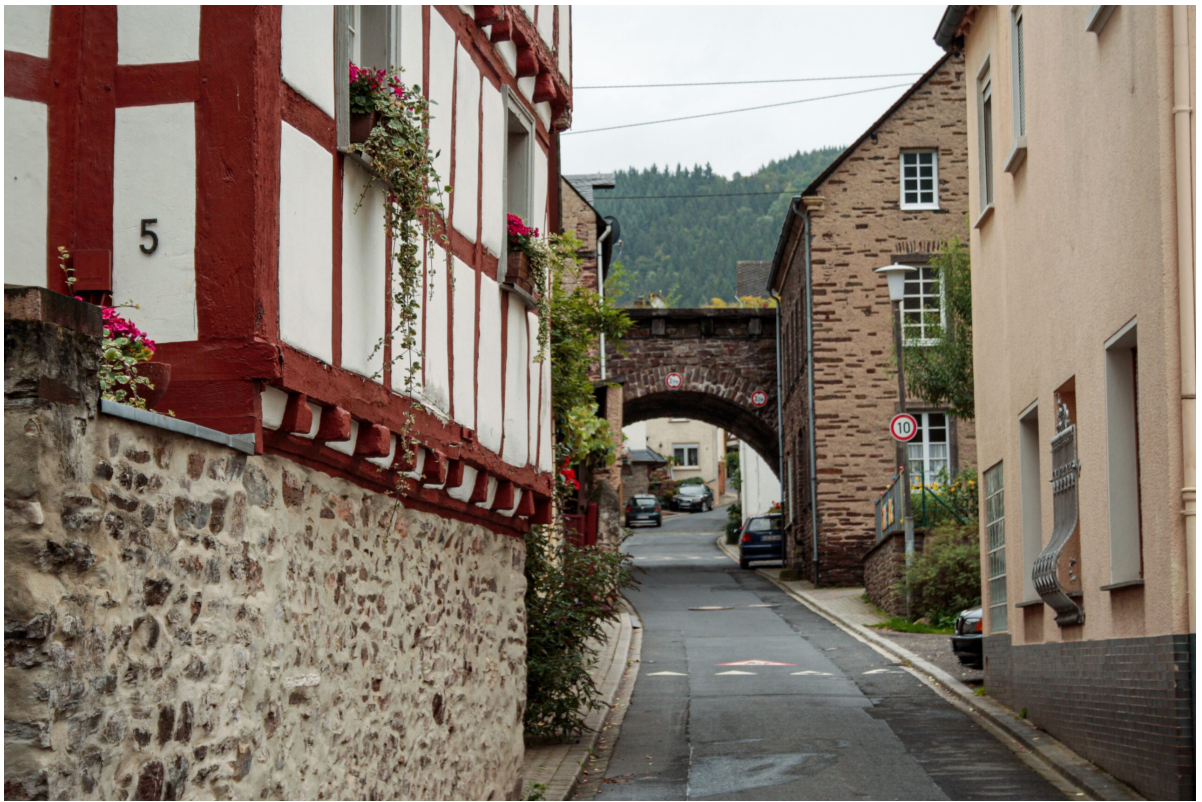
Bruttig an der Mosel

(unvergessen bleiben die selbstgemachten Nussecken), der mir als Kind die Wartezeit des Schleusens etwas versüßt hat und später der sogenannte „Schleusenwein“, der natürlich nur in Maßen genossen wurde.