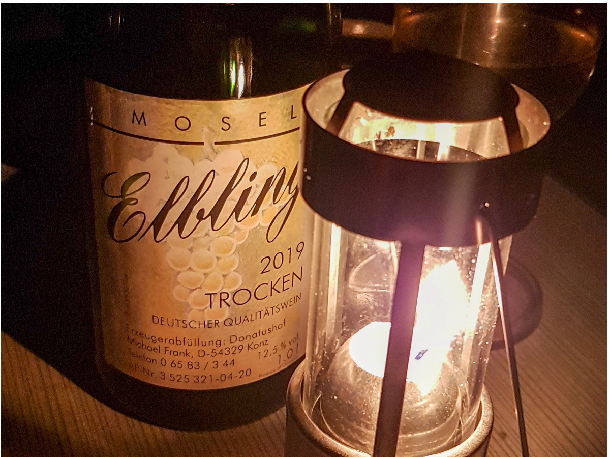
Abendstimmung in Palzem