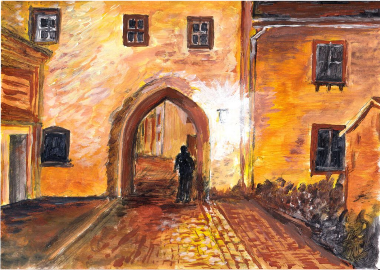
Zeichnung: Stadttor Kronenburg

So geht es in den nächsten Tagen weiter durch die Märchenwelt goldfarbener Bäume und durch Karpatenbirkenwald vorbei an Hexenringen und Schwefelköpfen - aber es soll kein Märchen erzählt werden, sondern eine wahre Reisebeschreibung durch fantastische und märchenhafte Eifelgebiete, in der uns aber auch die Grausamkeit schrecklicher Vergangenheit einholt.