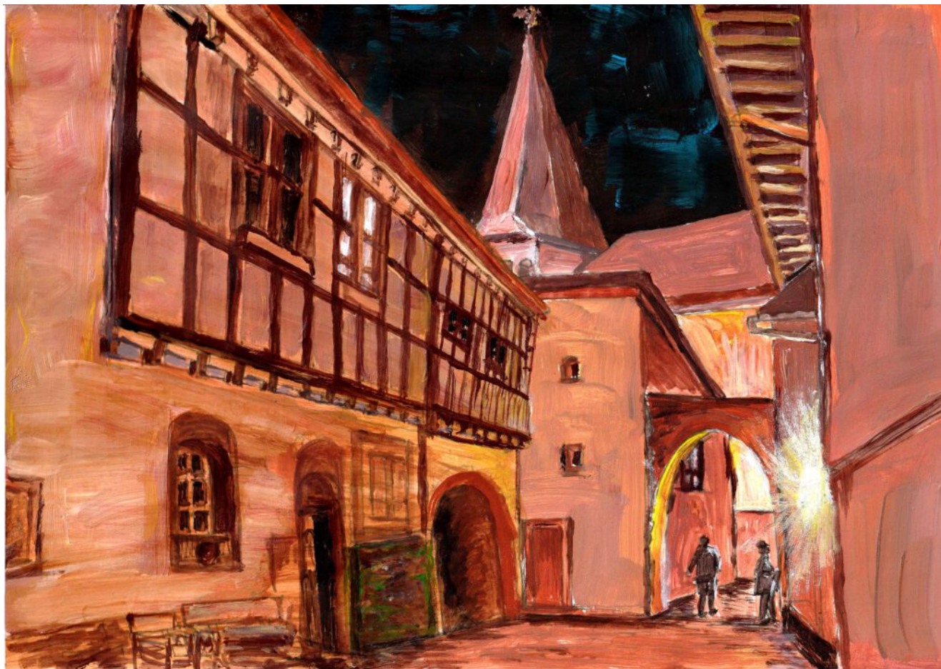
Zeichnung: Burgbering mit Blick auf die Kirche

die vier reich verzierten Gewölbe. Derartige Einstützenkirchen gibt es in der Eifel nur an 37 Stellen. Der spätgotische Kirchenbau mit seinen aufragenden Gewölben hinterlässt bei uns weinwn tiefen Eindruck. Wir genießen die Ruhe, halten Andacht, bevor es weiter geht auf unserer kleinen historischen Erkundungstour.