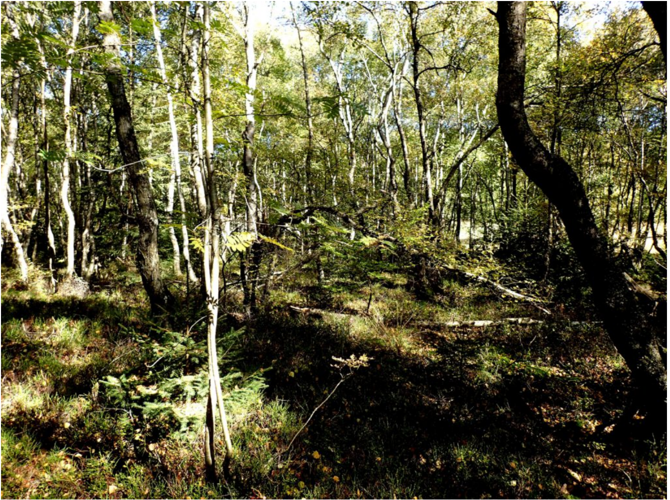
Nasse Moorflächen mit Karpatenbirken

Möchten wir bei derartigen Gedanken im Dämmerlicht oder im fahlen Schein einer Mondnacht über knorrige Baumwurzeln stolpern oder knarrende Holzbohlen unter den Füßen haben? Das Moor ist nicht so groß, als dass man sich darin verirren kann. Bald wandern wir weiter durch die offene Eifelandschaft in Richtung Ormont.