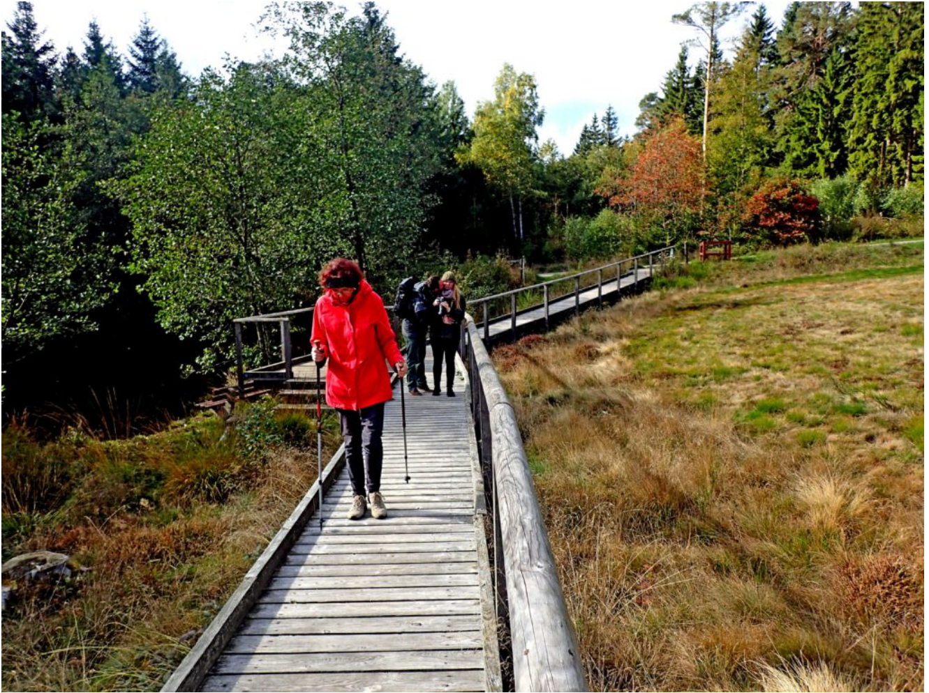
Moor bei Dahlem