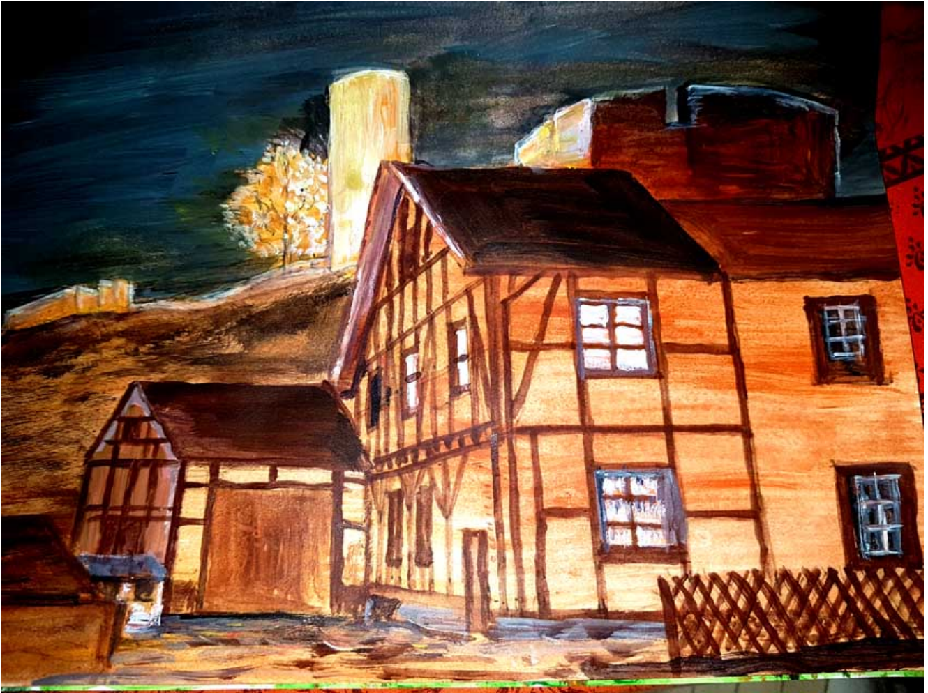
Zeichnung: Blick zur Kronenburg

Geschichtlich hat der Ort einiges zu bieten: Erstmals 1277 urkundlich erwähnt, wurde der Ort durch das Rittergeschlecht der Edlen von Dollendorf beherrscht, aus dem sich die eigenständigen Kronenburger Ritter entwickelten. Doch der Ritter Peter von Kronenburg starb ohne männliche Nachfolge 1414. So zählte Kronenburg zur Grafenschaft Blankenheim-Manderscheid und fiel unter Karl V bis 1715 unter spanische Herrschaft: Eine spanische Insel inmitten der Eifel! Als „spanisches Ländchen“ bezeichnet man noch heute den Ort, der allerdings zum Ende des 18. Jahrhunderts französische Kolonialhauptstadt, später Exklave des Hauses Mecklenburg-Strelitz wurde und ab 1819 an Preußen fiel.