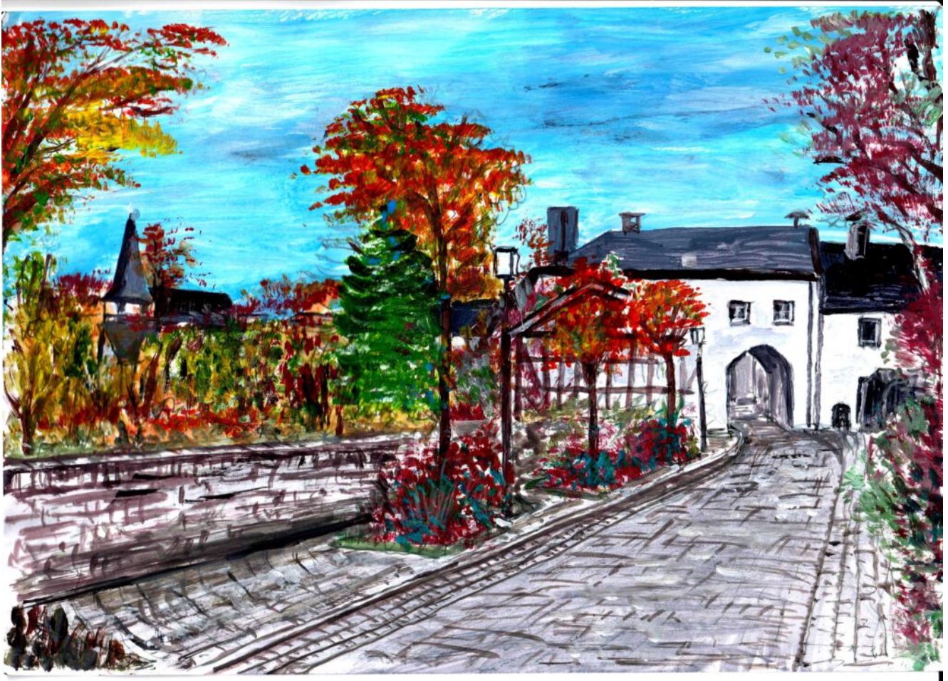
Zeichnung: Am Stadttor

Unter den Preußen hatte sich der Niedergang des kleinen Ortes fortgesetzt. Die Bevölkerung verarmte und der wirtschaftliche Niedergang führte dazu, dass keine Erneuerungen erfolgten. So blieb die ursprüngliche Bausubstanz erhalten. Heute sind es neben den Einheimischen besonders auch die mit ihrem Zweitwohnsitz in Kronenburg gemeldeten Bewohner, die zur Erneuerung der historischen Bausubstanz beitragen.