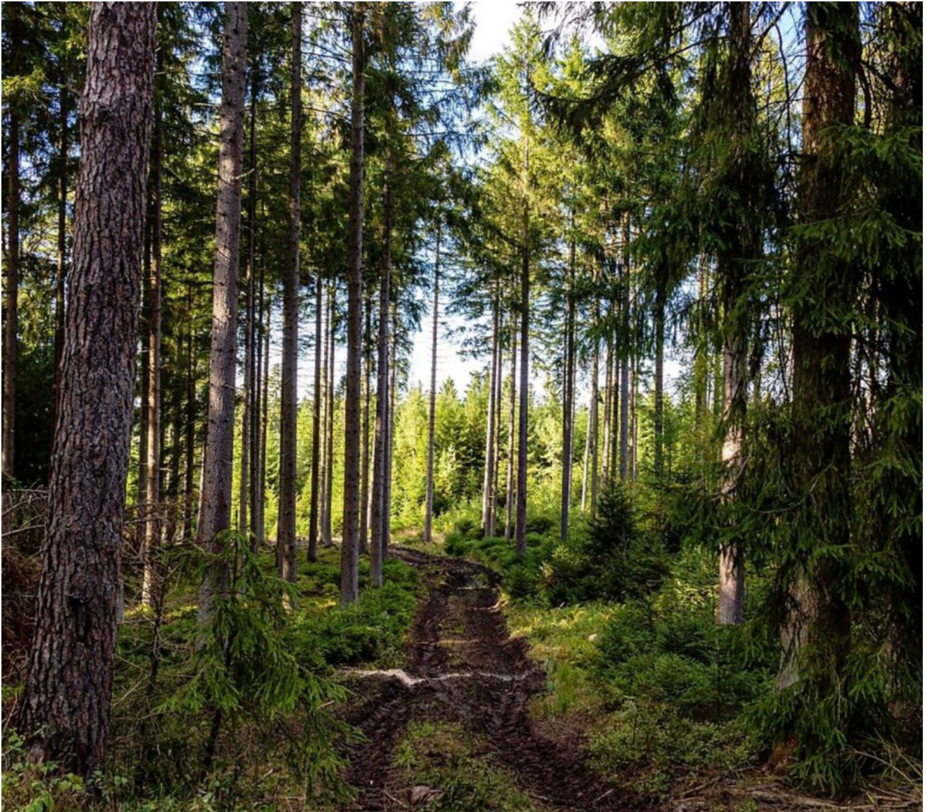
Wald bei Dahlem

Zum Glück habe ich das Handwerk des Pilzesuchens von meinem Vater gelernt und inzwischen über Jahrzehnte geübt, nun kann ich es weitergeben und so freuen wir uns über ganze Hexenringe köstlicher Steinpilze und Maronen. Die Graublättrigen Schwefelköpfe und die Krause Glucke zählen auch zu den Köstlichkeiten in unserem Pilzkorb. Nur die massenhaft auftretenden Hallimasch lassen wir lieber stehen. Sie sind etwas unheimlich und zählen zu den „leuchtenden“ Pilzen. Es ist eine besondere Eigenart des Hallimasch-Myzels, in der Dunkelheit zu leuchten. Durch diese Biolumineszenz entsteht an feuchtwarmen Abenden ein magisches Leuchten, ein Irrlicht oder Teufelslicht? Es gibt aber auch einen anderen Grund für unsere Enthaltensamkeit diesen Pilzen gegenüber: Der Name, so heißt es, kommt vom „Heil dem A...“, wegen seiner verdauungsfördernden Eigenschaft. So wurde aus unserer Moortour noch eine Waldwanderung, aber immer den Teufeln, Hexen und Untoten auf der Spur.