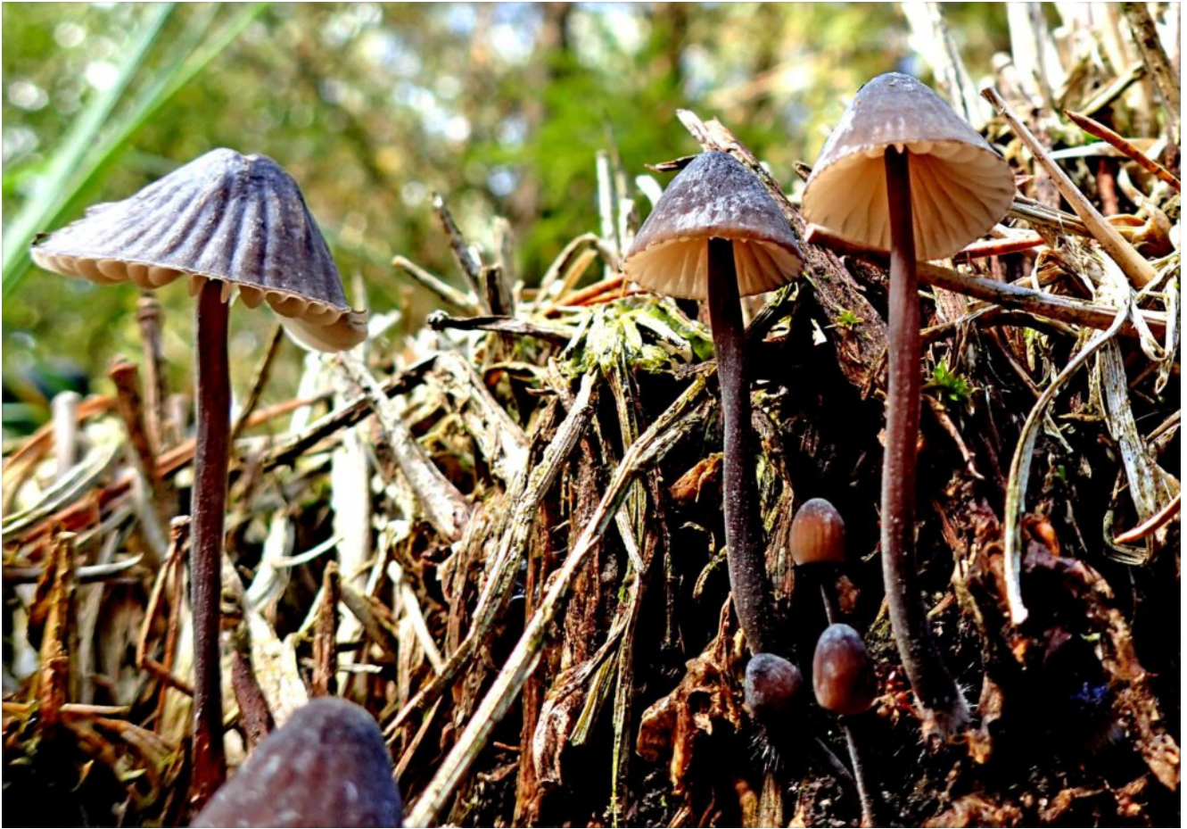
Kleine nicht essbare Pilze