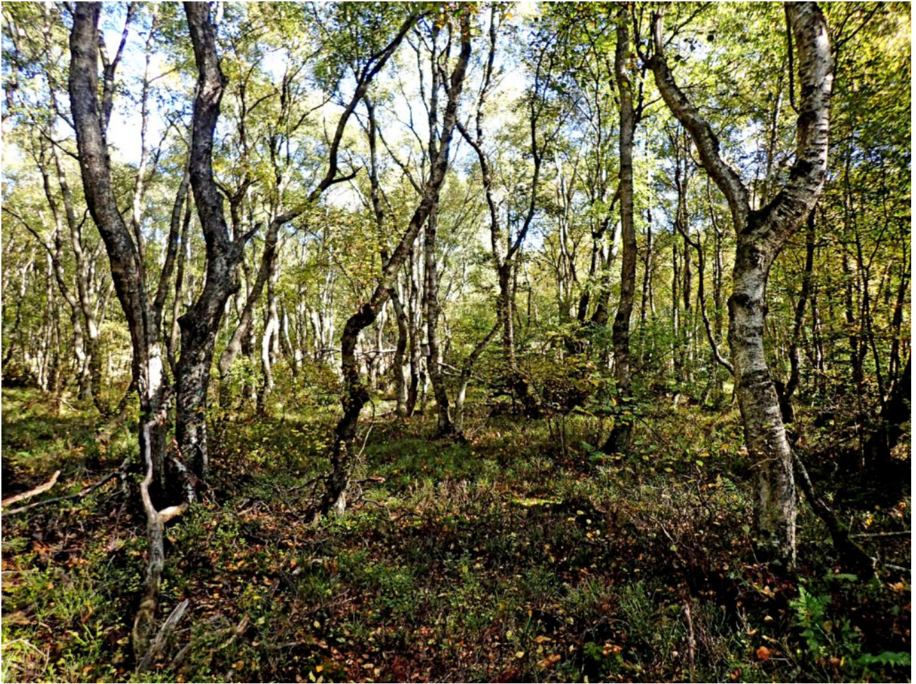
Karpatenbirken im Moor