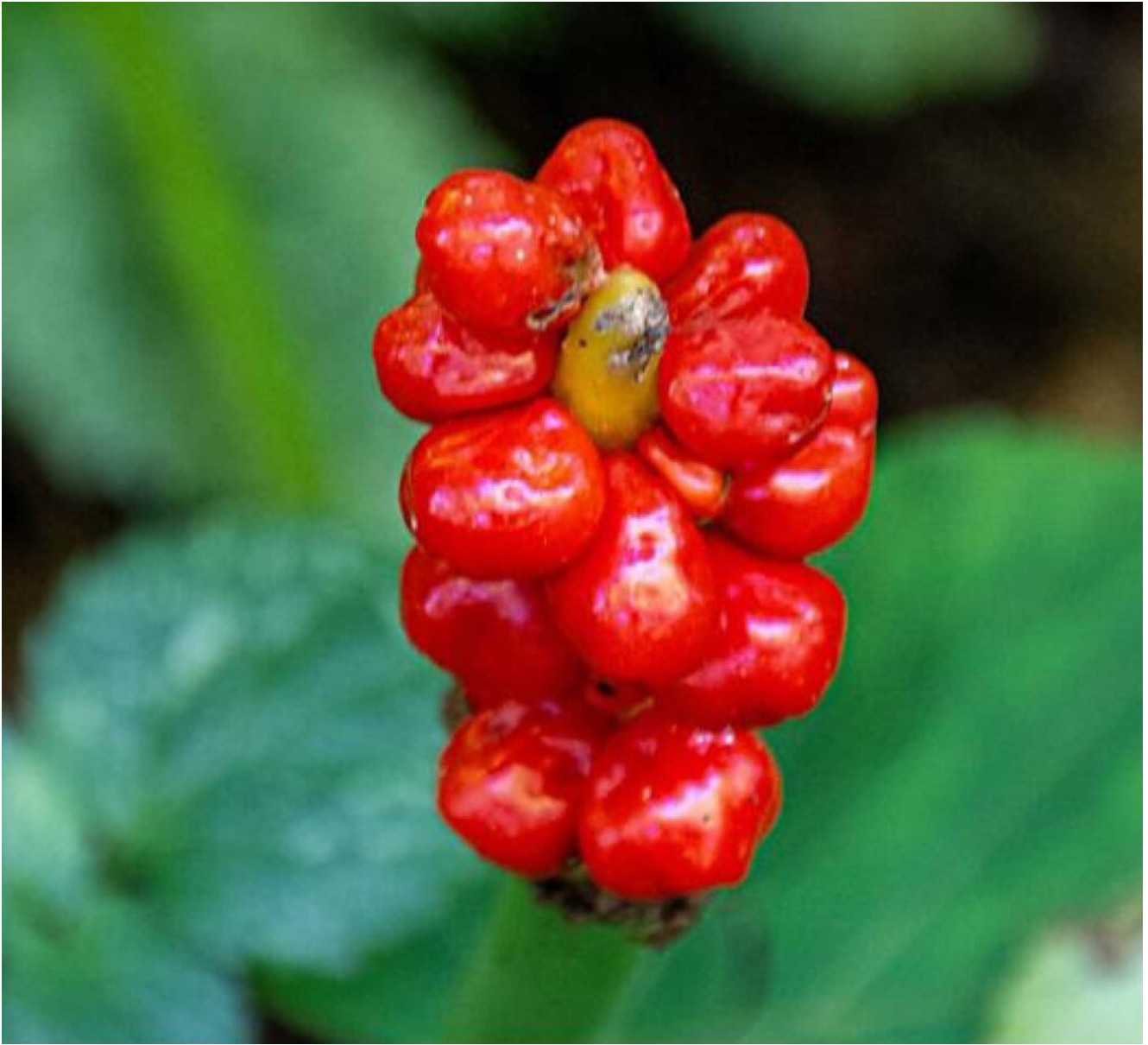
Die giftigen Früchte des Aronstabes

Aber die Naturbeobachtungen bringen auch immer wieder Überraschungen. Fast wären wir auf einen kleinen Zweig getreten. „Achtung, Schlange!“ ruft der aufmerksame Begleiter. Der Zweig entpuppt sich als Blindschleiche, die sich auf dem Weg sonnt und offensichtlich eingedöst ist. Regungslos liegt sie auf dem Schotterbett des Wanderweges. Beinlos gleicht sie einer Schlange. Anguis fragilis , zerbrechliche Schlange, hat sie der schwedische Naturwissenschaftler Carl von Linné genannt, dabei ist es aber eine Echsenart aus der Familie der Schleichen. Wie bei einer Eidechse kann der Schwanz leicht abbrechen, er wächst aber bei ihr nicht nach. Das Reptil des Jahres 2017 muss erst einige Fotos überstehen, ehe es sich windend davonschleicht und neben dem Weg im Gras verschwindet.